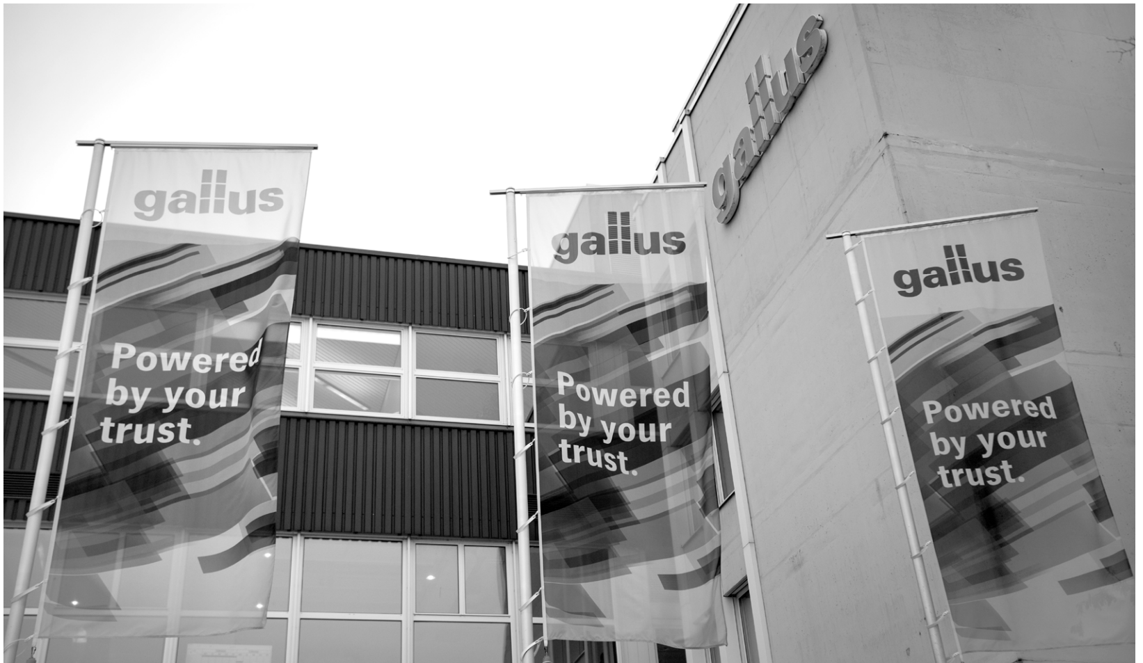
Der Hauptsitz der Gallus-Gruppe in St. Gallen.