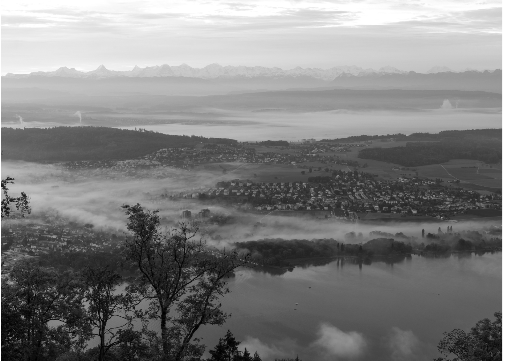
Aussicht von Magglingen aus aufs Mittelland