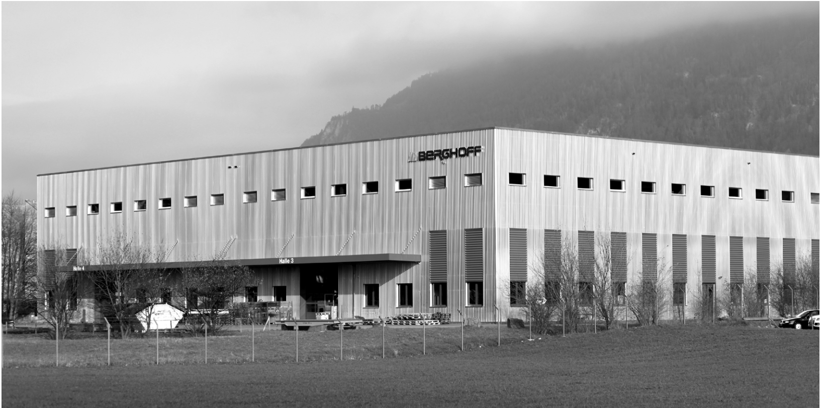
Der einstige Berghoff-Standort in Altdorf.